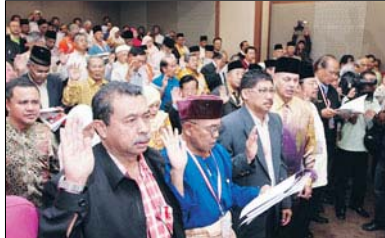
IKRAR... Para peserta Kongres Permuafakatan Melayu membaca ikrar yang terkandung dalam resolusi pada hari terakhir kongres itu di Johor Bahru, semalam.

Gambar-gambar sekitar Majlis Angkat Sumpah dan Persidangan Parlimen ke-12