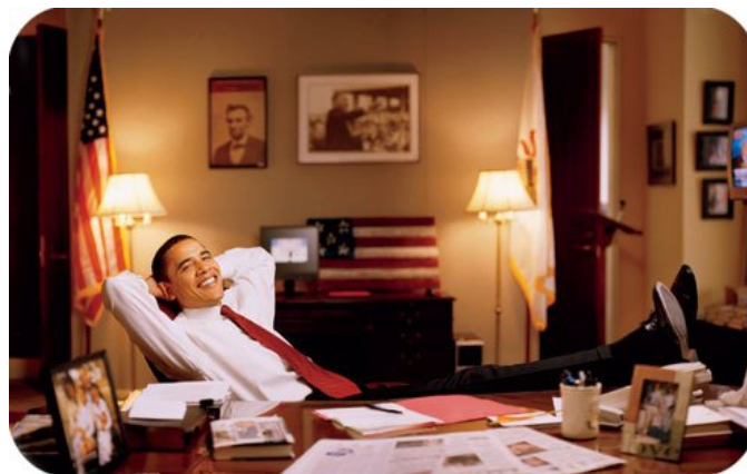
Abraham Lincoln og Martin Luther King på væggen

Kan I forestille jer vanskelighederne og udfordringerne Abraham Lincoln havde i sin tid? De som kæmpede mod ham, de som truede ham? Åh, ja, scenarierne er stadigvæk de samme - potentialet for attentat - men det behøver ikke være sådan, gør det? Det gør det ikke. Det behøver ikke at være på den måde. Dette væsen kommer tilbage, og åh, det handler ikke blot om Barack eller Abraham; det handler om bevidsthed - dette væsen kommer tilbage, men omgivet af visionære, omgivet af disse som er bevidsthedsarbejdere, som bringer denne energi tilbage til Jorden lige nu, men denne gang ikke på grund af en borgerkrig i USA. Denne gang er det på grund af globale justeringer, en ny vision, og nogle vil blive vrede.