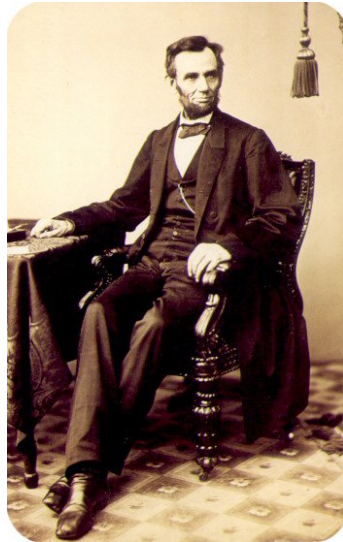
Abraham Lincoln (1809–1865)

Abraham Lincoln ved siden af Barack Obama. Se, lige der! Tegn blot et skæg på Barack, lav om på hudfarven af Lincoln - og I har det! Sådan er det. Abraham Lincoln kommer tilbage som Barack Obama - for at hjælpe med at bringe, ikke blot dette land - men hele verden til et nyt niveau.