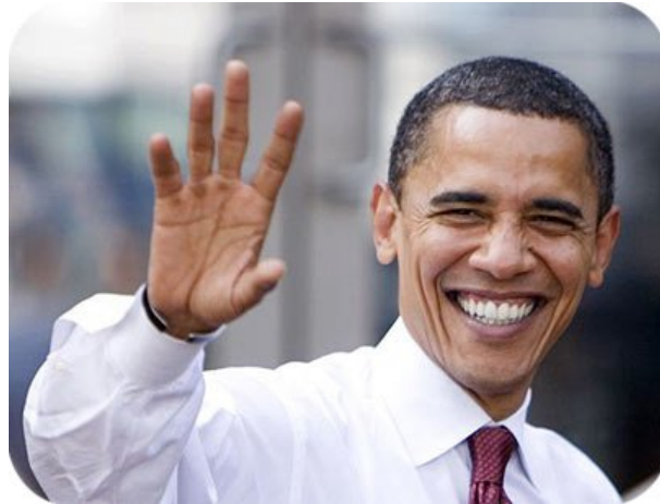
Indsættelse af Barak Hussein Obama som præsident - 20. januar 2009