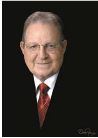
OLEGARIO VÁZQUEZ RAÑA