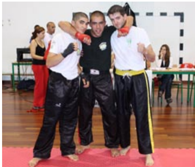
GRANDE ESPÍRITO DE FAIR-PLAY entre todos os competidores