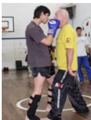
PREPARAÇÃO MENTAL para o combate