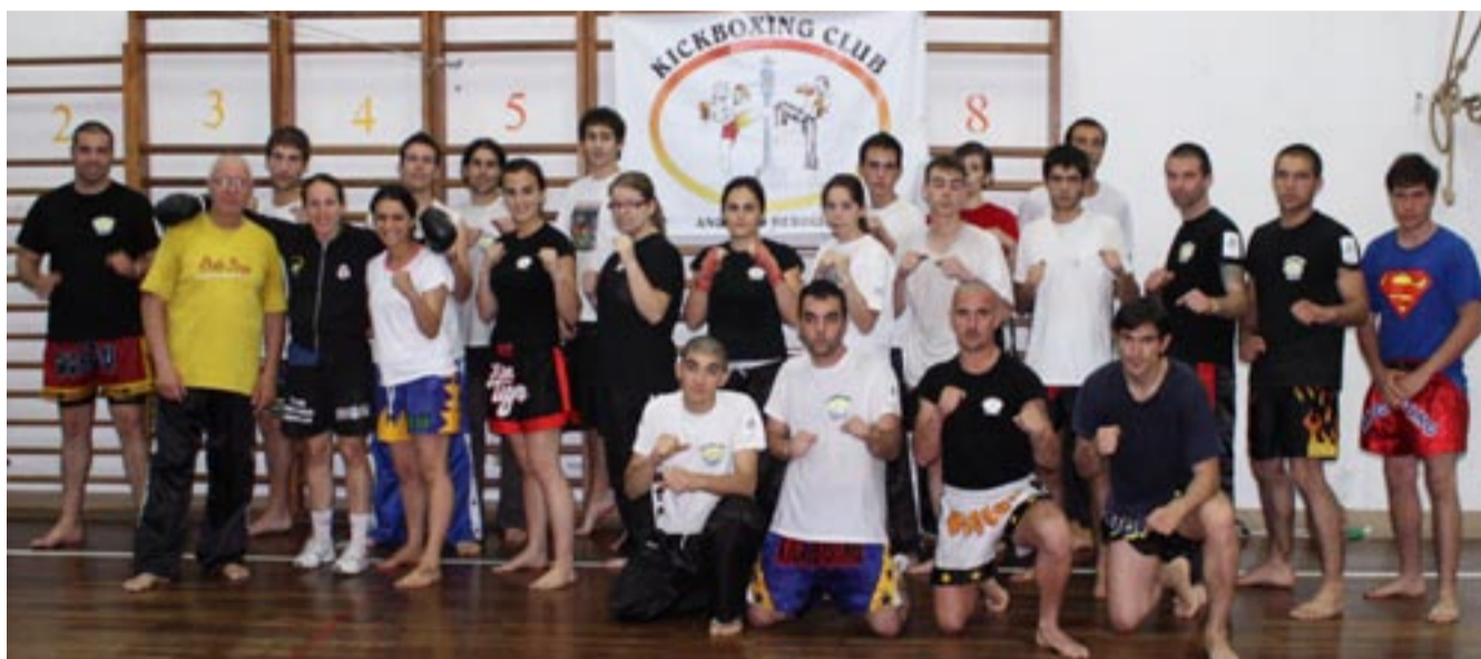
OS "RESISTENTES" DO ESTÁGIO quem conseguiu aguentar até ao final....tirou a foto da praxe