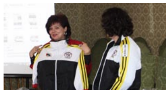
EQUIPAMENTO JÁ TÊM... agora só falta começarem a treinar Aerokick