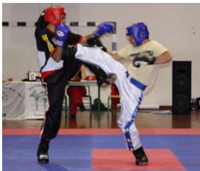
OS NOVOS VALORES DO KICKBOXING estão a aparecer nas competições