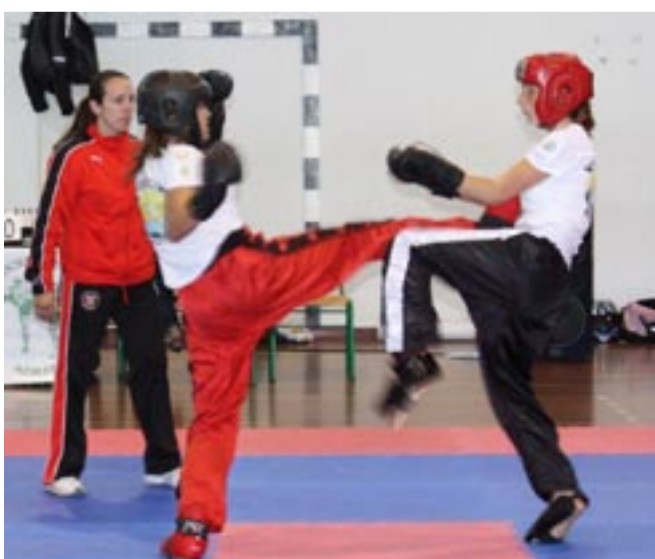
LUTADORAS FEMININAS com grande prestação