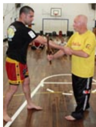
DEFESA PESSOAL técnicas com bastão