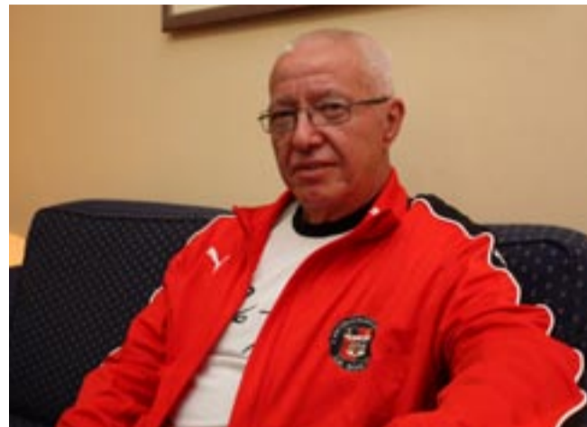
A SERENIDADE de espírito e a plenitude de quem sabe o que faz

Treinou nos quatro cantos do planeta terra, desde a Austrália até aos estados Unidos, onde lado a lado