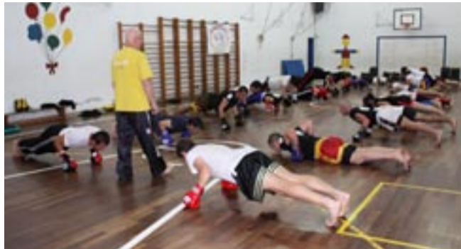
NESTE ESTÁGIO PRIMOU-SE PELA DUREZA FÍSICA Q.B. colocando mente e corpo unidos num só