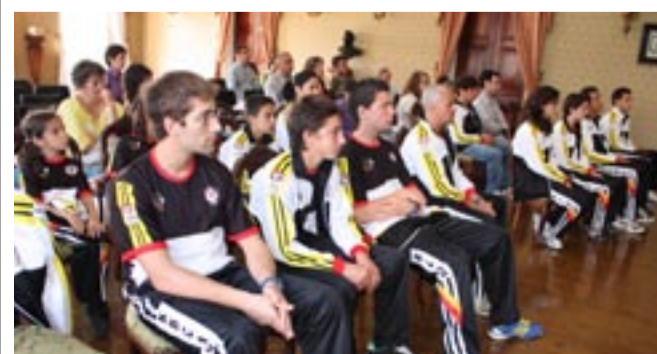
EQUIPA OFICIAL DE COMPETIÇÃO do Kickboxing Clube de Angra do Heroísmo