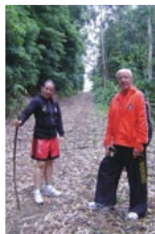
NO INTERIOR da ilha Terceira