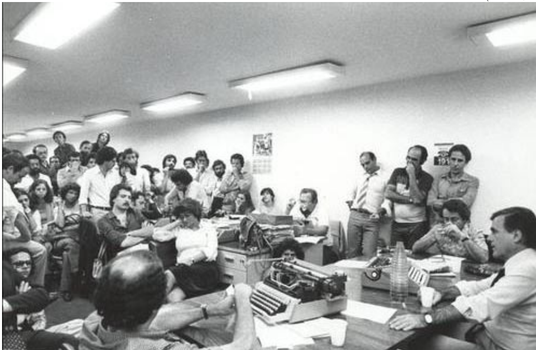
A última reunião do Jornal da República : à direita, fazendo o discurso de despedida, está Mino Carta.

Estava tudo certo para a salvação do Jornal da República e da própria empresa que o publicava, a Encontro Editorial. Mas o caminho seguido pelo novo dono, Fernando Moreira Salles, foi bem diferente do esperado. A promessa de uma “suspensão temporária” para o jornal não foi cumprida. Seria uma hibernação eterna.