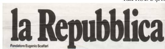
O logotipo do La Repubblica ; abaixo do nome, a referência ao fundador, Eugenio Scalfari.