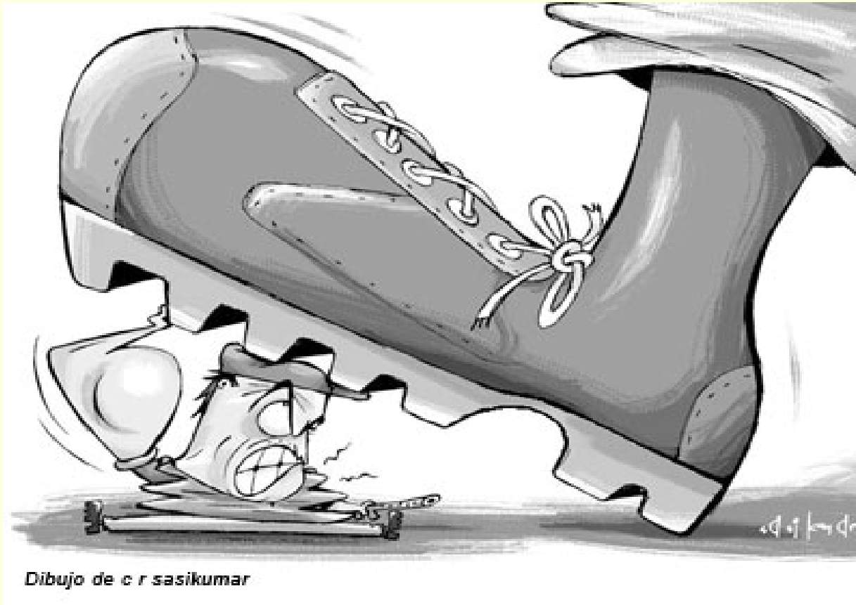
Dibujo de c r sasikumar