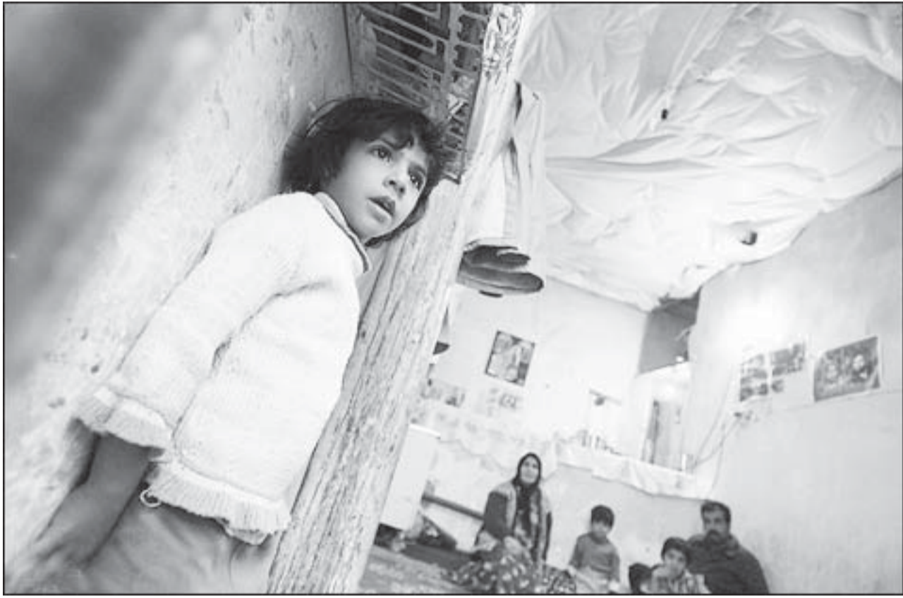
منزل مسکونی با سقف پلاستیک در جنوب شهری