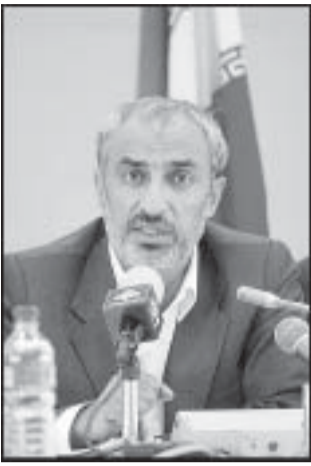
وزیر علوم در جریان دیدار با اعضای هیئت مدیره دانشگاه یزد

رفعت بیات در گفتگو با ایسنا خاطر نشان کرد: یکی از مشکلات اساسی ما اینست که حزب به معنی واقعی نداریم و جناح‌ها برنامه اصولی دراز مدت برای حل مشکلات جاری در کشور را ندارند، در نتیجه تنها روی اسامی و افراد کار می‌شود. وی با تاکید براینکه چنین مشکلاتی را باید با یک تعامل فکری و اندیشمندانه حل کرد افزود: مردم نباید گرفتار تنازعات سیاسی بین تفکرات افراد شوند. بیات در ادامه با بیان اینکه تشکیلاتی به نام مجلس و دولت در سایه ایجاد کرده ایم، ابراز عقیده کرد: از آنجاکه متاسفانه قانونگذاری‌ها در هر دوره به دلیل مشکلات ساختاری در آئین نامه‌ها و همچنین نبود یک تعریف کار کردی از تفکیک بین دو قوه مقننه و مجریه دچار یک فراز و نشیب می‌شود، تشکیلاتی به این نام ایجاد کردیم تا از این طریق بتوانیم به بررسی مباحثی که در جامعه مطرح است ولی برای آن طرح و لایحه‌ای در نظر گرفته نشده، بپردازیم.