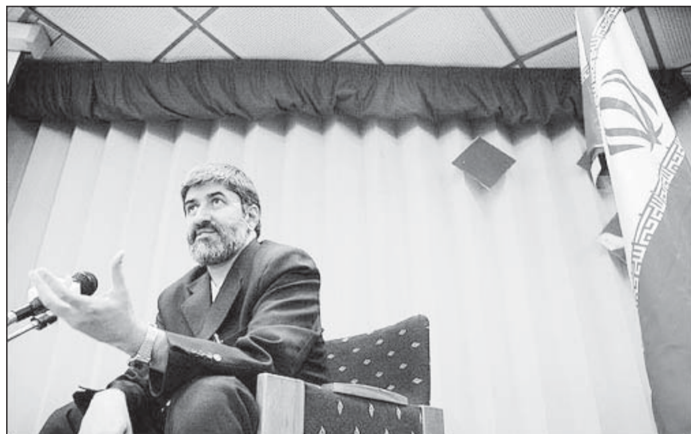
علی مطهری چند روز پیش از این نطق، به عنوان مخالف کردن سخنرانی کرد.

خود را رها نکنیم آنها راضی نخواهند شد. اکنون امریکایی ها سخن از تحمیل فرهنگ خود بر دنیای اسلام می رانند. بی جهت نیست که پس از اشغال افغانستان و عراق اولین کاری که کردند تغییر کتاب های درسی آنها و حذف آیات جهاد و مبارزه با کفار از آنها بود و در ایران نیز در درجه اول برآنند که فرهنگ غربی را با ابزارهایی از قبیل ماهواره ها و فیلم های خانمان برانداز و دسترسی آسان نوجوانان و جوانان به مواد مخدر جایگزین فرهنگ اسلامی کنند و متأسفانه دولت ما توجه لازم به مسائل فرهنگی را ندارد و به این بهانه که باید با ریشه ها مبارزه کرد از نظارت جدی بر مسائل فرهنگی پرهیز دارد و حتی همکاری لازم را با طرأ ارتقای امنیت اخلاقی جامعه اعمال نمی کند. در نتیجه این طرح به صورت یک طرح تشریفاتی درآمد و به نظر می رسد بیشتر برای ساکت کردن افشار متدین جامعه است که بله، ما در حال انجام اقداماتی هستیم، در حالی که به اتفاق فقها آن بخش از امر به معروف و نهی از منکر که مستلزم اعمال قانون باشد به عهده دولت اسلامی است.