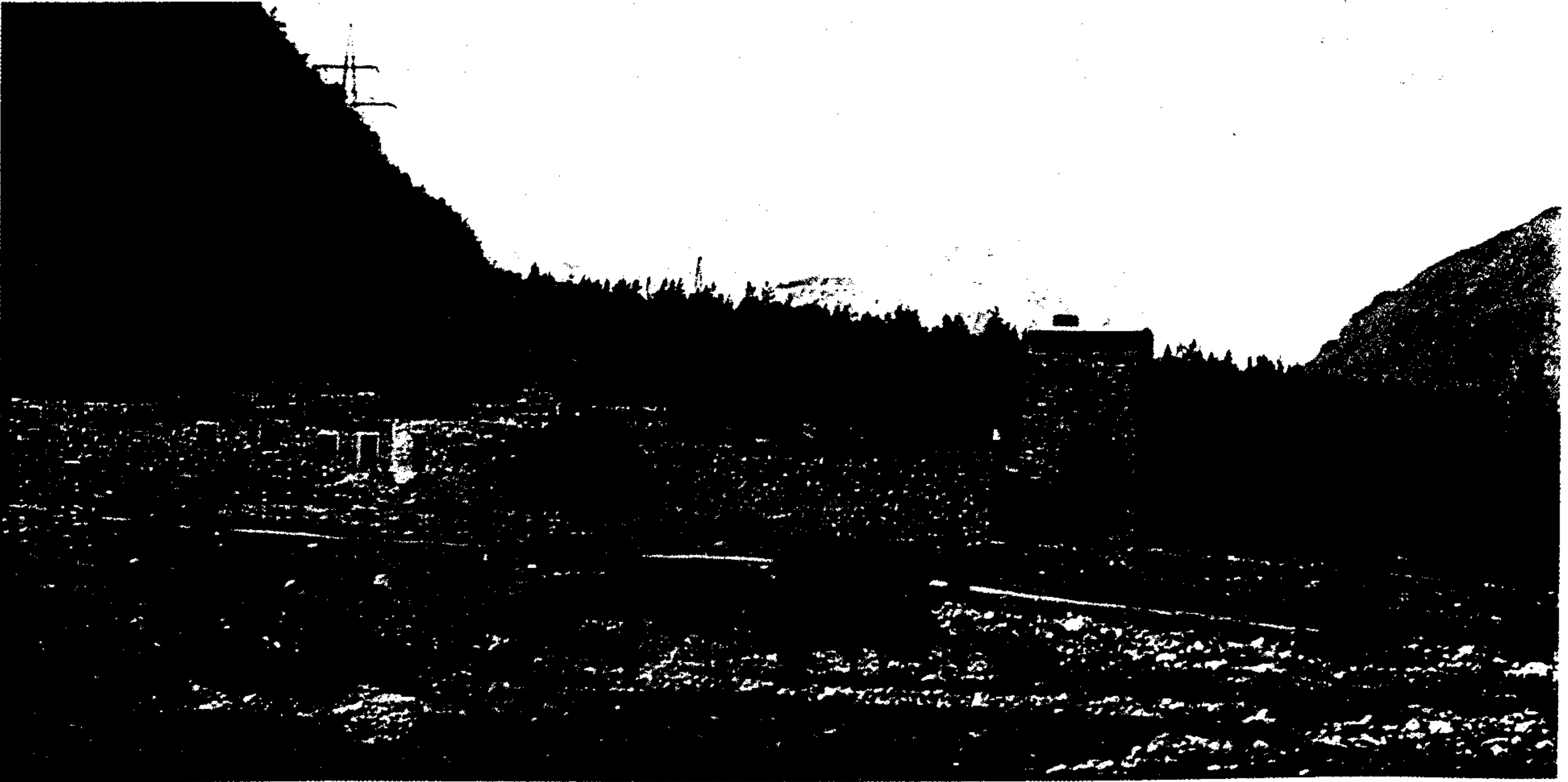
Ruslarla yapılan savaşlarda kullanılan bir gözetleme kulesi (Baksan)

Toprakları tahıl yetiştirmeye elverişli olmadığı için bu gereksinimlerini genellikle Kabartay Çerkesleri 'nden karşılıyorlardı. Daşkov bununla ilgili olarak 1626 yılında şunları söylüyor: " Malkar ülkesi ile Kabartay ülkesi arasında araba yolu olmadığı için Malkarlar, Kabartay Çerkesleri'nden satın aldıkları tahılları çuvallara doldurup sırtlarında taşıyarak kendi ülkelerine getiriyorlar. " Tarıma elverişli toprakların azlığı dağlık ve engebeli arazinin fazlalığı, kış mevsiminin uzun sürmesi, Malkarlar'ın tarla işleriyle uğraşmalarına engel olmuştur. Büyük zahmetlerle taşların temizlenmesi ve ağaçların kesilmesiyle elde edilen az sayıdaki düz arazileri sulama imkanı