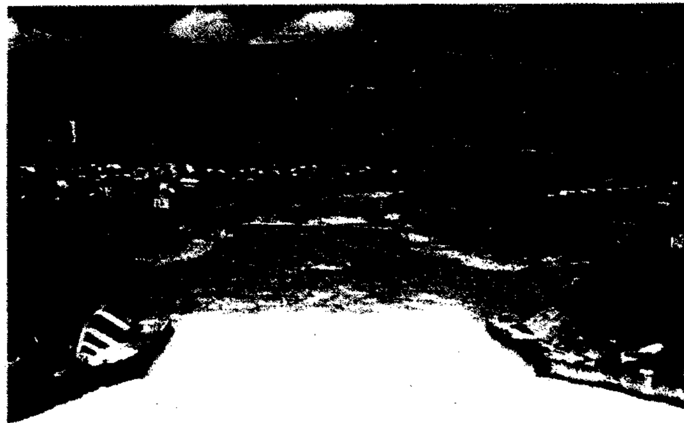
Kuban Nehri üzerinde bir çağlayan (Karaçay)