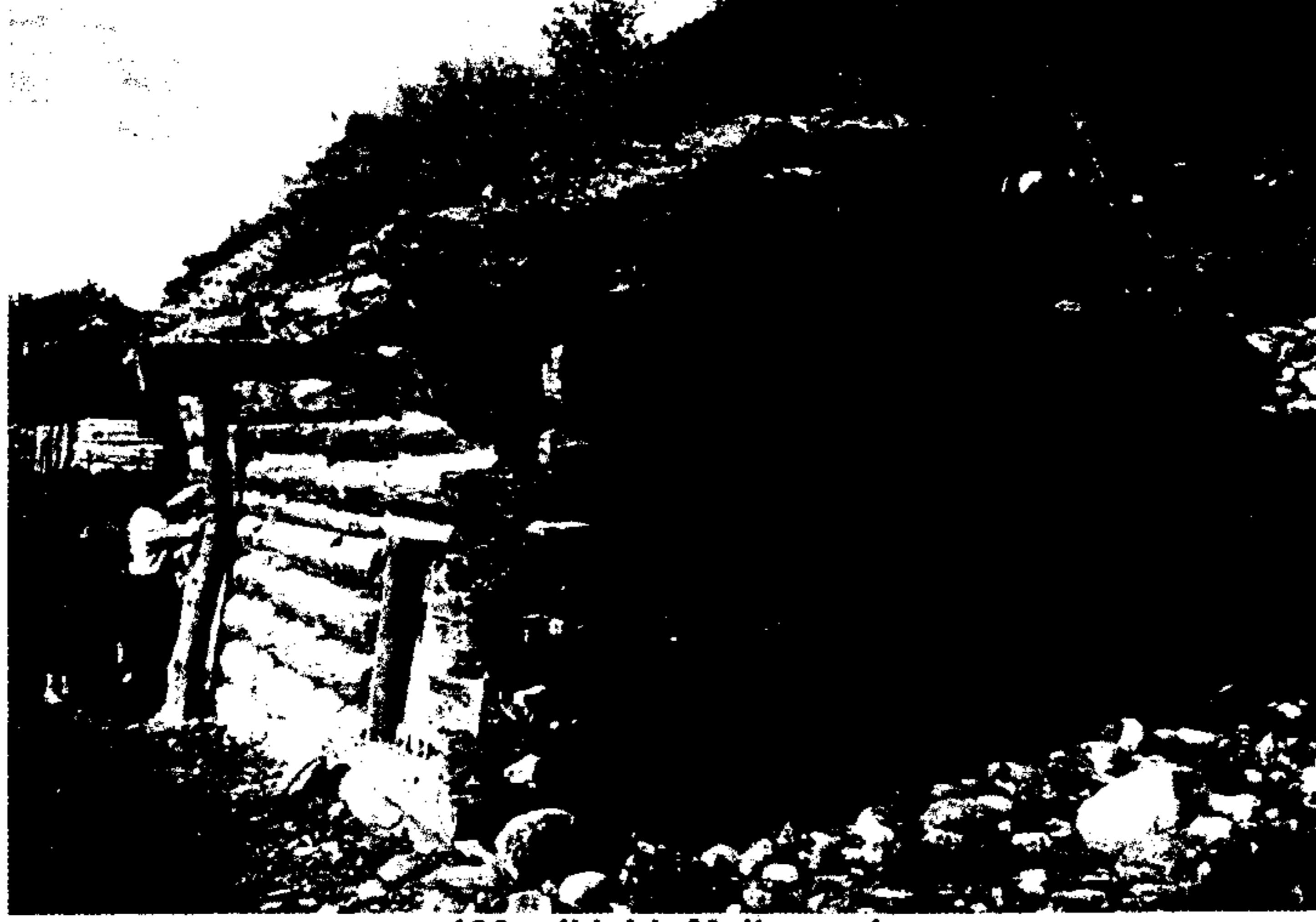
100 yıllık bir Malkar evi

XIX. yüzyılın ikinci yarısından itibaren Malkarlar ekonomik bakımdan oldukça ileri bir seviyeye gelmişlerdi. Buna bağlı olarak zenginler daha da zenginleşirken, fakirler ise daha da fakirleşiyorlardı. Fakir aileler sadece prenslerin tahakkümünde olmakla kalmıyor, Çarlık Rusyası'nın tayin etmiş olduğu Rus memurlar tarafından da eziliyorlardı. Bütün bu şartlardan dolayı 1855 yılında Çegem ve Holam vadisinde bulunan fakir köylüler: "Fazla vergi azaltılsın, mera ve çayırlar herkese eşit olarak kullandırılınsın" sloganıyla bir isyan çıkardılar. 1862 yılında Girhojen'in fakir köylüleri: "Bundan sonra kimseye kölelik yapmayacağız" slo-