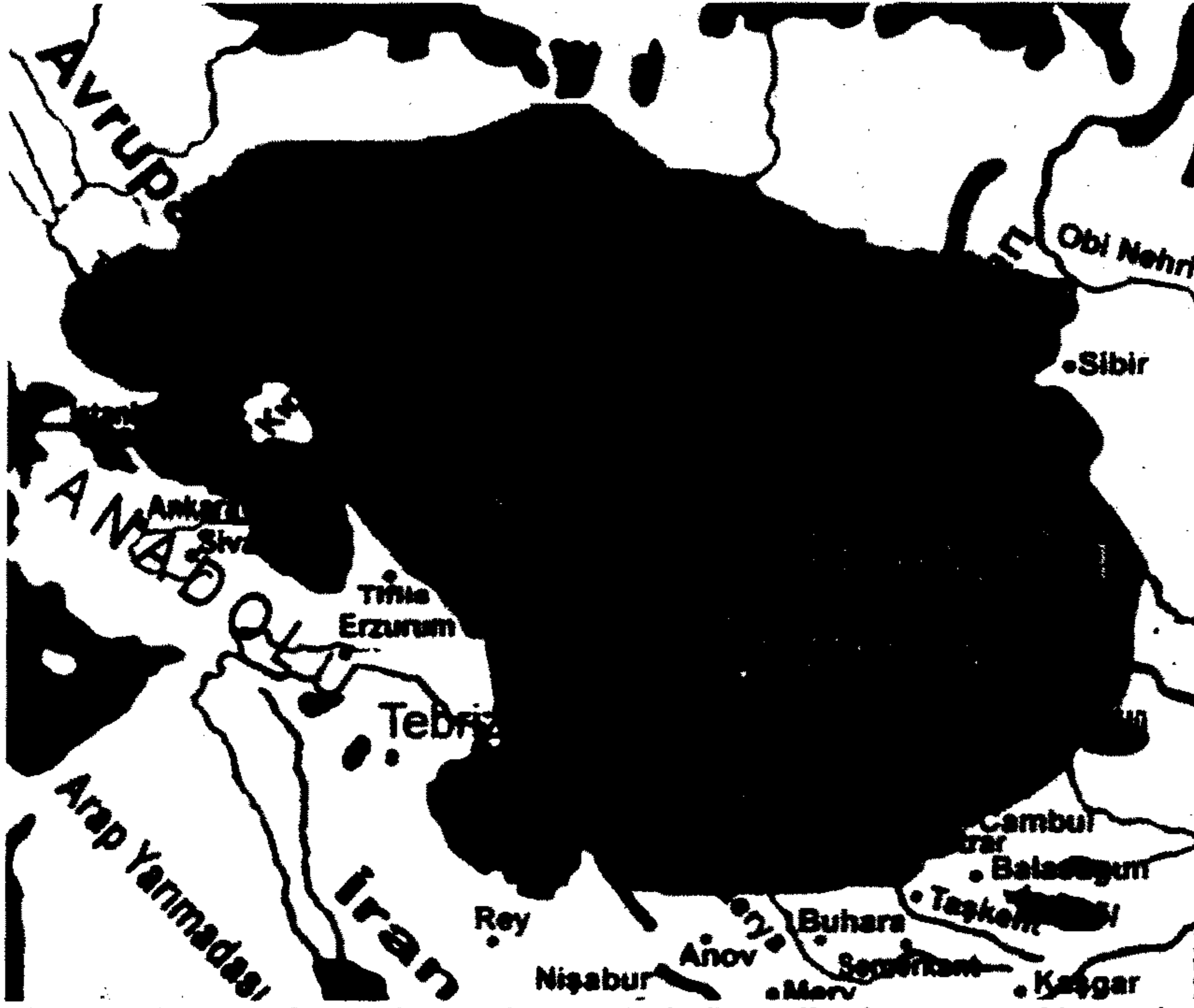
Malkarlıların Kafkasya'ya yerleşmesinde önemli rol oynayan Altınordu Devletinin o tarihteki sınırları

munun nasıl meydana geldiği konusundaki kendi görüşümüzü bazı tarihi gerçeklere dayanarak ortaya koymaya çalışacağız. Bilindiği üzere, XIV. yüzyılda Altın Orda Devleti, "Kök Orda" ve "Ak-Orda" şeklinde bölünmüştü. İtil (Volga) Irmağı civarı ve onun batı tarafındaki topraklar ve Kırım ile Kuzey Kafkasya bölgeleri Kök Orda Devleti'nin hakimiyetinde bulunuyordu. Arap seyyah El-Ömer'in söylediğine göre, Moğollar'ın hakimiyetinde bulunan kavimler arasında en kalabalık ve en güçlü olanı "Kıpçaklar" idi. Kıpçaklar'ın sahip olduğu topraklar oldukça geniştir. Daha sonra Tatar-Moğollar bu toprakları istila ederek Kıpçakları hakimiyeti altına aldılar. Ancak Moğollar'ın nüfusu Kıpçaklar'a oranla daha az olduğundan Moğollar zamanla Kıpçaklar ile karışıp kendi dillerini kaybederek tamamen Kıpçaklaştılar.