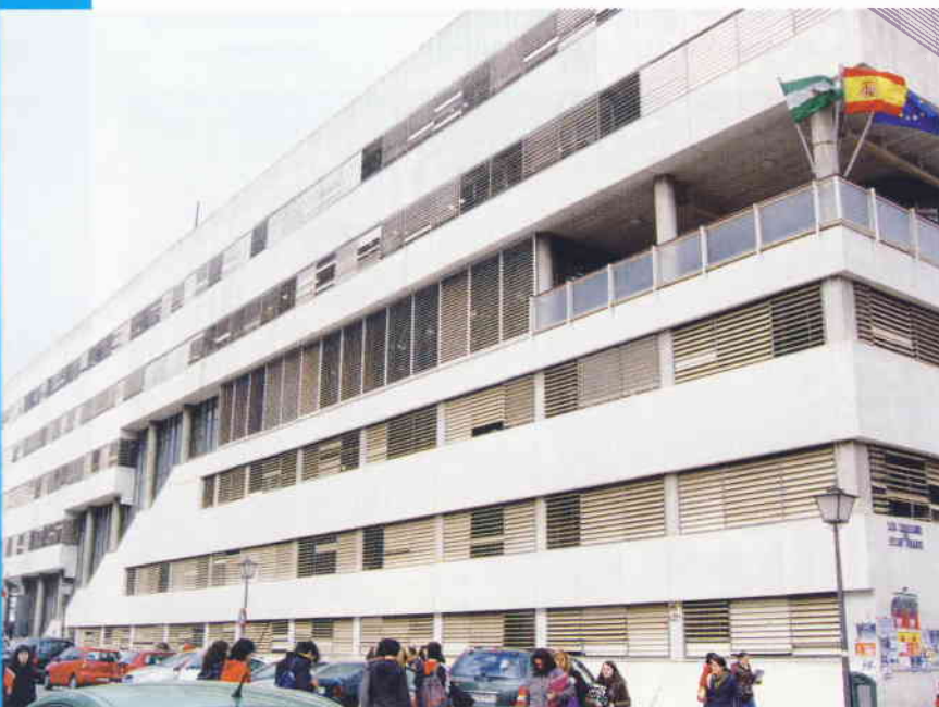
Imagen de la Facultad de Farmacia de la Universidad de Sevilla.