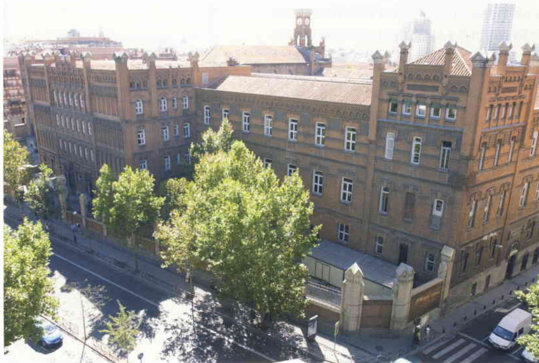
Edificio ICADE de la Universidad Pontificia Comillas.

—Tenemos en España mucha necesidad de profesionales bien formados y competentes en Relaciones Internacionales, precisamente debido a que no existía en nuestro país una formación de grado. Tenemos camino que recuperar y, por tanto, también espacio que ocupar. Yo diría que las expectativas profesionales en estos momentos son excelentes, partiendo del supuesto que la formación que recibe el alumno a lo largo de los estudios, curse donde curse sus estudios, también sea de alto nivel.