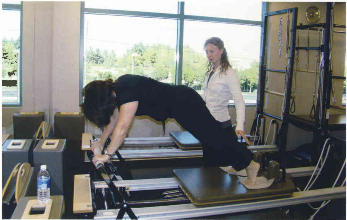
Esta disciplina ayuda a las personas con limitaciones después de una patología o enfermedad a desenvolverse de nuevo en su entorno.

Terapia Ocupacional es formar profesionales terapeutas ocupacionales generalistas, con preparación científica y capacitación suficiente como para que puedan describir, identificar, prevenir, tratar y comparar problemas de salud a los que se puede dar respuesta desde la Terapia Ocupacional. La Terapia Ocupacional utiliza actuaciones, técnicas, procedimientos, métodos y modelos que, mediante el uso con fines terapéuticos de la ocupación y el entorno, promocionan la salud, previenen lesiones o discapacidades, o bien desarrollan, mejoran, man-