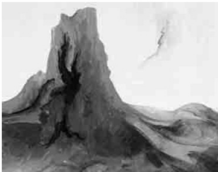
UNA DELLE OPERE DI SALVATORE FRATANTONIO ESPOSTE A CALTAVUTURO